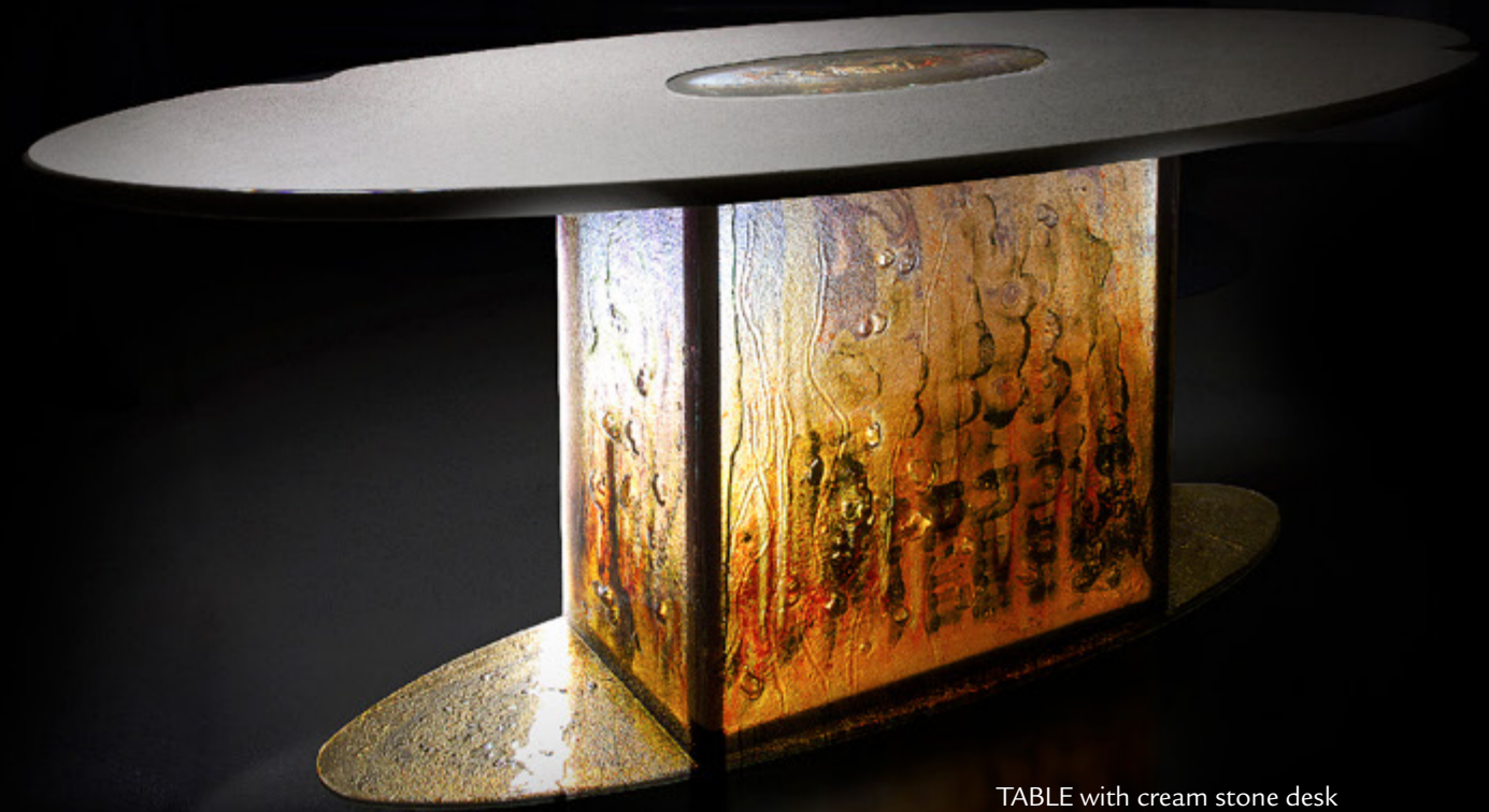
TABLE with cream stone desk combined with glass elements