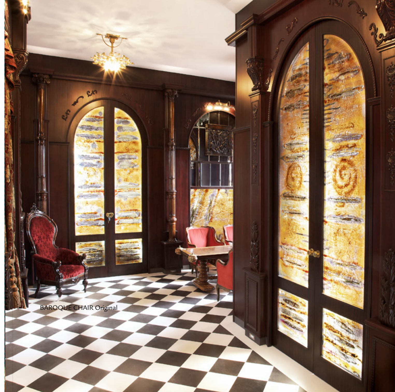
BAROQUE CHAIR Original