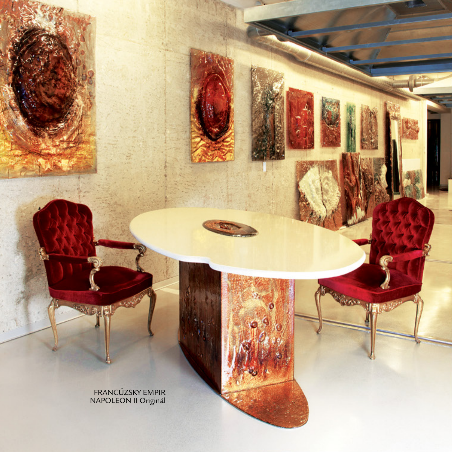
FRANCÚZSKY EMPIR NAPOLEON II Originál