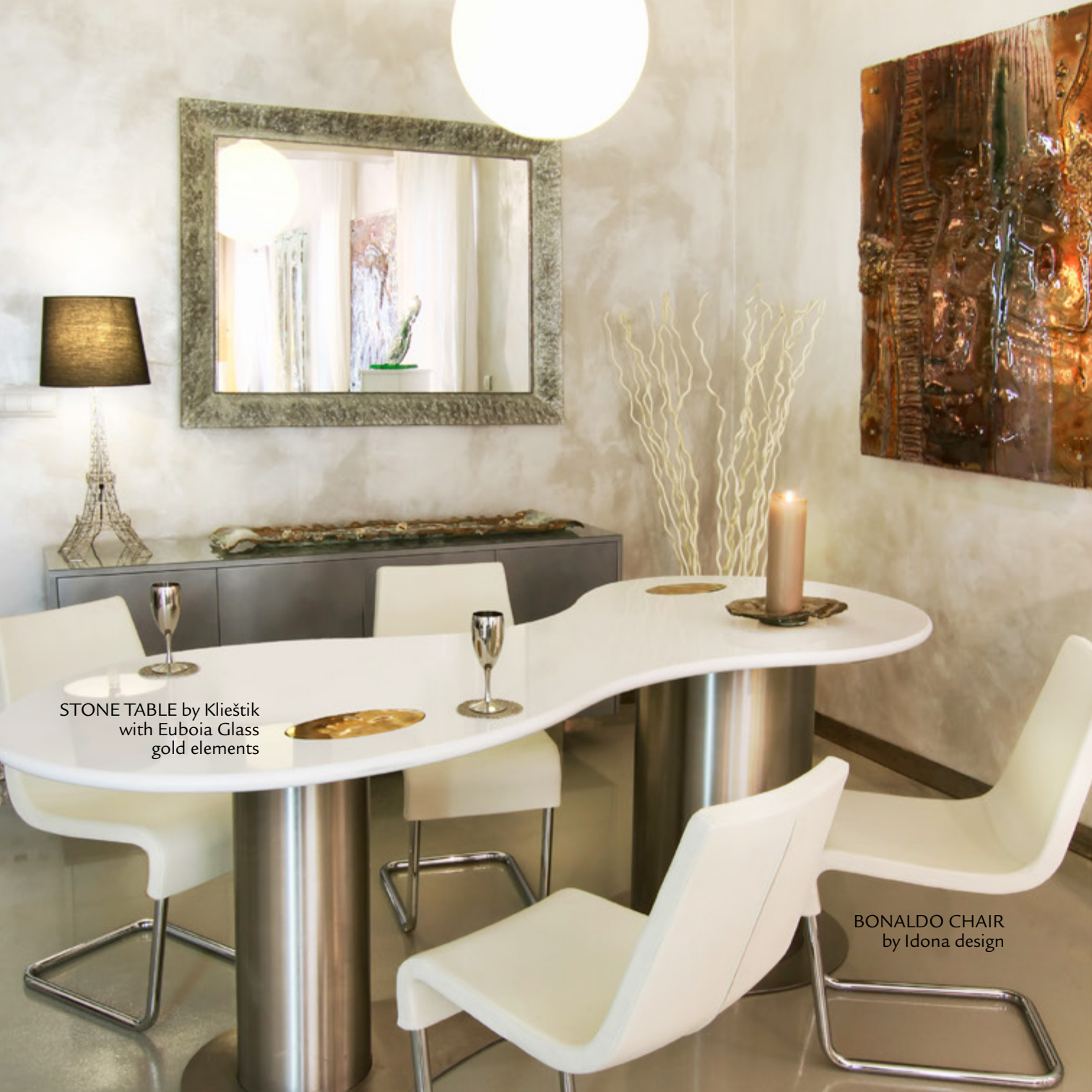
STONE TABLE by Klieštík with Euboia Glass gold elements