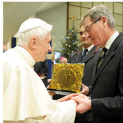
SPECIAL GIFT TO POPE BENEDICT XIV.

1/ THE CROSS / GIFT TO POPE BENEDICT XVI